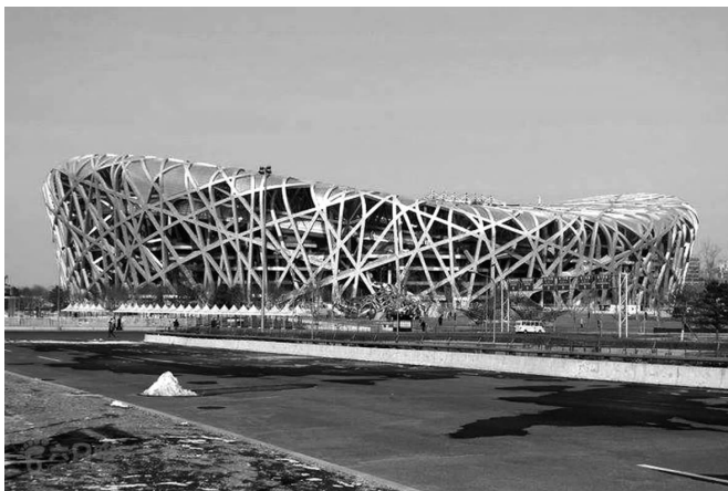
图 1-2 鸟 巢

另一方面,建筑具有文化艺术的一些共同属性(如建筑的民族性、地域性和时代性),即不同的民族、地域和时代的建筑在建筑形式和风格等方面表现出不同的特点。