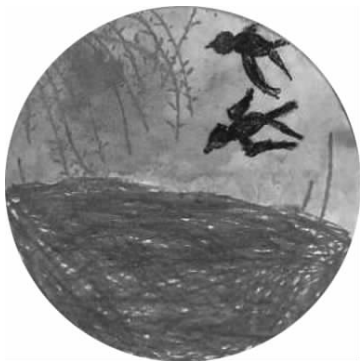
图 1-6 儿童色彩画

的表现,在纸上塑造可视的、形象的美术活动,以表达儿童对周围生活的认识和情感。它既可以作为色彩基础性的练习,也可以用于进行写生和绘画创作。图 1-6 所示为儿童色彩画。