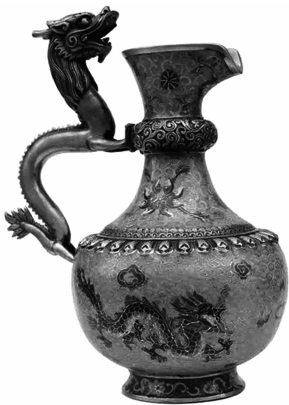
图 1-5 景泰蓝/陈设工艺

工艺美术通常分为两类：一是日用工艺，又称为实用工艺，是指对有关衣、食、住、行等实用品进行加工装饰的工艺品，如灯具、桌椅、绣花等家居用品；二是陈设工艺，是指以摆设、欣赏功能为主的工艺品，如陶艺、壁挂、器具等陈设品，如图 1-5 所示。