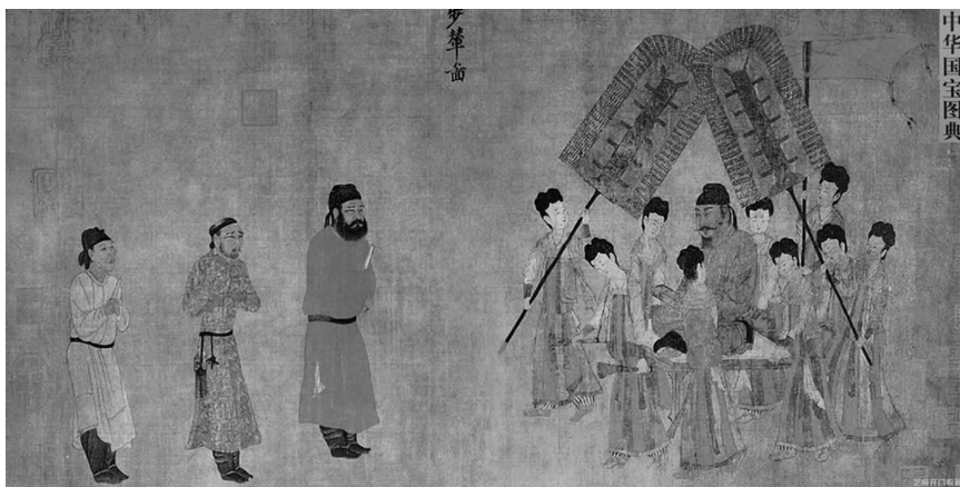
图 1-1 中国画《步辇图》局部

图 1-1 所示为中国画《步辇图》局部。《步辇图》是唐朝画家阎立本的名作之一,是现藏于北京故宫博物院的中国十大传世名画之一。该作品设色典雅绚丽,线条流畅圆劲,构图错落富有变化,为唐代绘画的代表性作品,具有珍贵的历史和艺术价值。