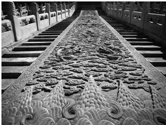
图 1-4 故宫/浮雕

现三维空间,并只以一面或两面供观看。浮雕一般是附属在另一平面上的,因此在建筑上使用更多,在用具器物上也经常可以看到,如图 1-4 所示。