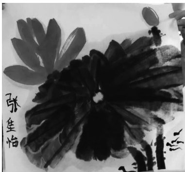
图 1-7 儿童水墨画

儿童水墨画是我国一种具有悠久历史传统的绘画艺术,是以墨色的浓淡变化描绘对象的色彩关系,从观察到的对象中获取形象的特点,利用空白造成虚实相间的艺术效果。儿童学画水墨画,可从小就接触和了解继承民族的传统绘画形式,对培养他们热爱祖国、热爱大自然的思想情感有着积极的作用。图 1-7 所示为儿童水墨画。