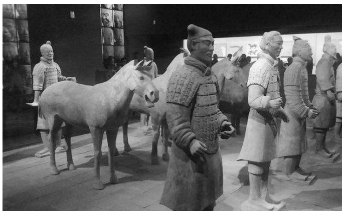
图 1-3 秦始皇兵马俑/圆雕